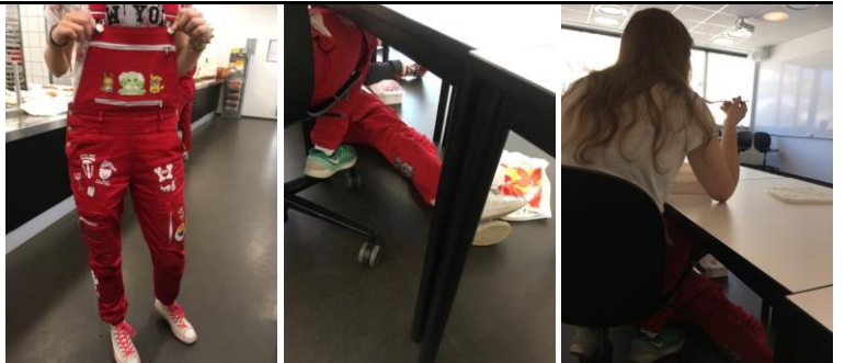
(左) ルスのつなぎ。上の部分を下すとノルウェー国旗がプリントされています。(中) 床で授業を受けているルスの子。(右) アイス2リットルに挑戦していた子。結局達成ならずでした・・・

しようとしています。達成したら帽子にピンなどを付けます。一般的なものは「授業中に2リットルのアイスを食べる」「授業中床に座って受ける」「パンを靴の代わりにして過ごす」「Eggsen (山) のふもとからセントラムまで四つん這いで移動する(オスロの場合はセントラムから城までだった気がします)」「五月に入る前に海に飛び込む」過去ではある先生が、急に授業中に誕生日でもないのに誕生日会を開かれて、みんないかにも誕生日かのように祝ってくれた、嬉し