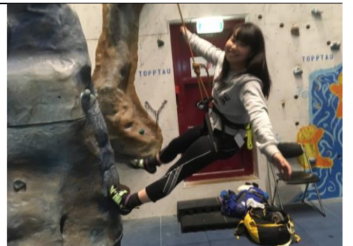
写真を撮ってもらってばかりで一緒に撮った写真がなかったです…。

レイジーなイベントと国の誕生日があるからです。そのことは来月書きたいと思います。以上、今月のレポートでした!遅くなっていますみませんでした。