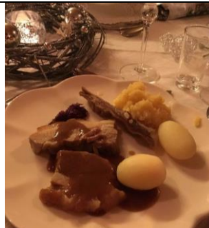
奥の細長い肉が pinnekjøtt です。じゃがいもと一緒に食べます。

下旬、クリスマス休みに入り、ホストマザーの妹の家でクリスマスを迎えました。一概に北欧といえるのかわからないのですが、北欧では24日に家族と共に祝いします。朝から家に行き、クリスマスの朝食を食べ、夕方までゆっくりして、夜ご飯を食べました。特に私の住んでいる西ノルウエーでは 'pinnekjøtt' という羊の肉を食べるのが一般的で、私も食べましたが肉のくさみが強く私はちょっと苦手でした。ベルゲンからちょっと内陸にいったところの Voss という場所の発祥らしいのですが、そこでは羊の頭を丸ごと焼いていただくそうです。