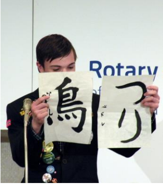
(原稿は次号以降に掲載致します。)