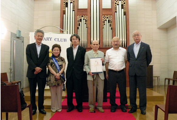
今年度は5名の方が表彰されま