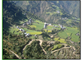
目指す桃源郷マテタ村

翌日は早朝 6時30分にチャーターした2台の車と先導してくれるパトカーに分乗して出発し、途中この事業に協力頂いている岐阜ネパール会で現地にて旅館を営ん