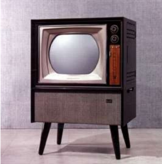
CT-150型カラーテレビ (日立製作所提供 1960年)

昭和35年9月にカラー放送を開始し、東京オリンピックという大イベントをバネにほぼ10年で90%近い普及を果たし、昭和38年11月には初の日米衛星中継を行い地球のどこからも映像を各家庭に送り届けられるシステムを構築しました。衛星中継での最初の映像がケネディー大統領の暗殺事件だったことは今も忘れられませんが、平成24年には完全デジタル化を果たします。これにより高画質な映像はもちろんのこと、様々な情報の送り出し、さらに多チャンネル化の扉も開き、まだまだテレビは進化し続けています。番組を送り出す側だけでなく、受ける側も大きく変わりました。いまや、録画装置がついていないテレビしかないご家庭はどのくらいあるのでしょうか。今日お集まりの方々の受像機には、すべて映像記録システムがついていると思います。 昭和50年ごろから普及し始めたVTRは少しずつですが、テレビの視聴スタイルを変えていきました。好きな時間に好きな番組を見る人が増えてきているのは事実です。さらに、ハードディスクレコーダーの普及により録画可能時間は飛躍的に増え、見る時間が足らなくなっているほどです。 ところで、いまお宅のテレビ受像機で見ることのできるチャンネル数はどのくらいおありでしょうか？