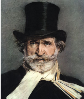
ジュゼッペ・ベルディ (1813年 - 1901年)

地で記念演奏会や、記念行事が催 されています。今日はベルディの レクイエムについて話をします。 ベルディはイタリアが生んだ最 大のオペラ作曲家です。アイダ、 椿姫、オテロなどが代表作です。 そのオペラ作家がレクイエムを1 曲書いています。イタリアの文豪 「アレックスサンドロ・マンゾーニ」 の為に書かれました。1周忌にあ たる1874年5月22日にミラ ノのサン・マルコ教会で、ベルデ イの指揮、スカラ座管弦楽団で演 奏されました。この曲はオペラ作 家が書いただけあって、大変コー ジャスな曲となっています。テレ ビなどでもよく流れます。 イタリアの北部にベローナとい う町があります。ロメオとジュリ エットで有名な街ですが、そこに は古代ローマ時代のアレーナが現 存しています。1913年から 夏に、この3万人収容できるアレ ーナを舞台に音楽祭が行われてい ます。舞台も大きく、いわゆる野 外劇場ですので、アイダなどの グランドオペラは圧巻です。この アレーナ・ディ・ヴェローナ音楽 祭にオペラとともによく演奏され るのがレクイエムです。夏の日も 沈みようやく暗くなる頃に、ドラ の音で開演が告げられます。演奏 が進むころは夜のとぼりが下りた ころです。客席ではそれぞれがキ ヤンドルを足元に立てて、舞台か