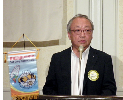
・RI3510地区青少年交換委員会 / 台湾