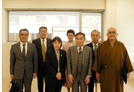
「ゆうゆう診療所」 〒453-0027 名古屋市中村区大門町 19 番地 052-481-7771 http://www.ne.jp/asahi/yuyu/med/