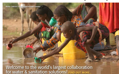
Welcome to the world's largest collaboration for water & sanitation solutions! FIND OUT MORE.

ミニカ共和国、ガーナ、フィリピン、の3カ国で、水と衛生設備に関する長期的プロジェクトを実施するため、米国際開発庁（USAID）と国際H2O協力を始めました。3年目を迎える今年、ドミニカ共和国では衛生研修とバ