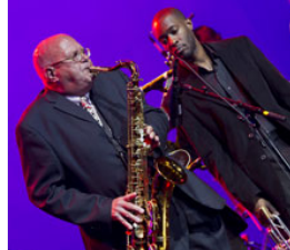
大会参加者たちは、ニューオーリンズならではの最高の音楽に酔いしれました。出演者には、

ロータリーアクター、学友、ロータリアン、ロータリーの家族が、2005年のハリケーン「カトリーナ」の被災地域で、一軒家の建築、図書館の建設、ペンキ塗りなどの復興活動を手伝いました。