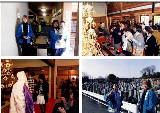
お彼岸法要お手伝い中の様子 (HF会資料)