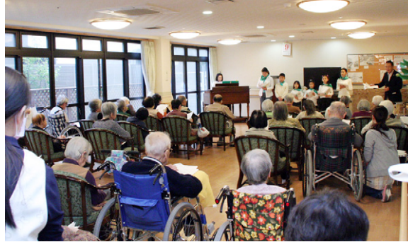
約1時間程度、児童合唱団「ぼこ・あ・ぼこ」などによる 合唱や、楽曲演奏などが披露されました。

■ 地区大会 11月15日(土)・16日(日) 於 ウェスティンナゴヤキャッスル 15日(土) 大会第1日目 13時00分~17時30分 地区指導者育成セミナー 9時30分~11時30分 RI会長代理ご夫妻 歓迎晩餐会 18時00分~20時00分