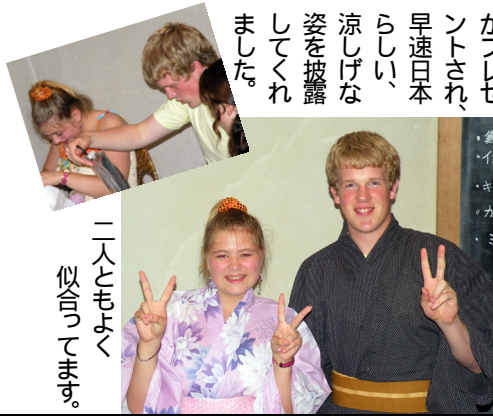
二人ともよく似合つてます。

7月4日(金) 帰国を間近に控えた留学生二人を囲み、パーティーが開かれました。クラブからは記念に「浴衣」がプレゼントされ、早速日本らしい、涼しげな姿を披露してくれました。