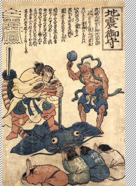
鯰絵「鹿島大明神地震御守」

食用には一部の地域で蒲焼やフライなどで食べられるが、あまりピュアではありません。皆様はいかがですか。