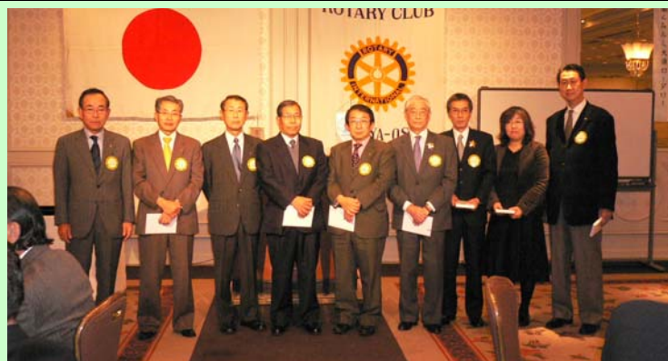
米山功労者クラブ、功労者表彰