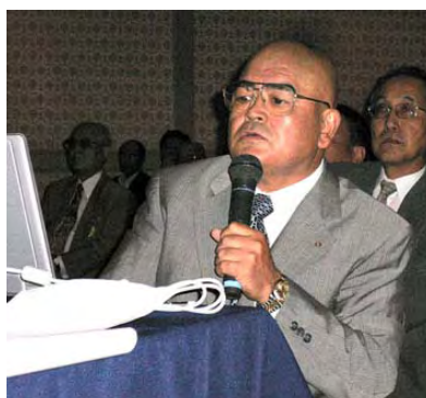
制定案 07-01 理事会付託