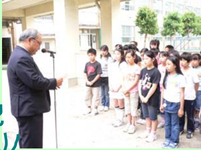
名古屋市立老松小学校へ飼育セットとともに、メダカを贈呈