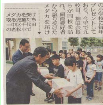
メダカを受け取る児童たち(中区千代田の老松小で)

都会の子供に「自然」を提供。メダカを育てることは、子供にとって大切な経験です。大須 RC は、今年もメダカを寄贈することにしました。