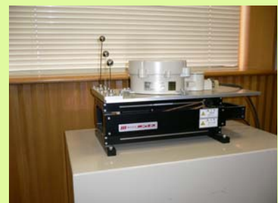
地震計にて神戸地震の揺れを再現