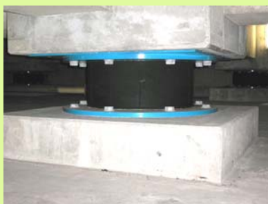
建物地下部分の免震装置