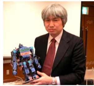
鉄人 28 号と古橋助教授