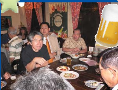
珍しいビールに舌鼓