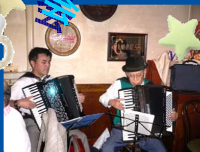
♪アコーディオン生演奏♪