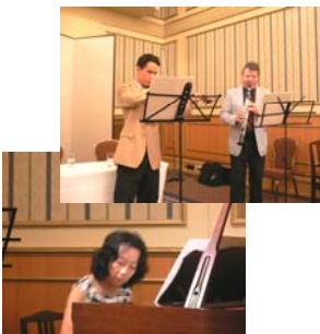
ウェバー一家の 素敵な調べに感激