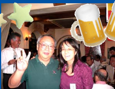
澤屋さん壮行会も兼ねて！ 銭別も贈呈しました！