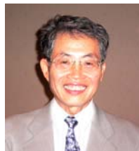
笑顔の草野会長 お疲れ様でした！

私は7月の1021回例会から6月29日の1070回例会までの50回を担当させていただきました。休会4回を含んでいますので、実質46回でした。