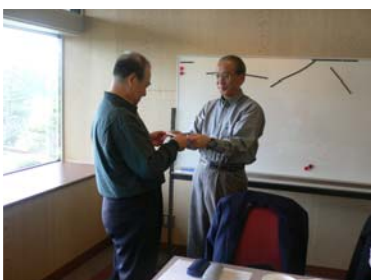
岡田会長から賞金授与

皆さんとても有難うございました。良きパートナーと幸運に恵まれて優勝することが出来ました。当の本人がビックリで、ゴルフの優勝は長年縁がなくまさかと思いましたが、早きは三文の得で当日ゴルフ場一番乗りが幸いしたのかもしれませんが、今後ともよろしく願いいたします。