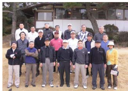
スタート前の勢ぞろい