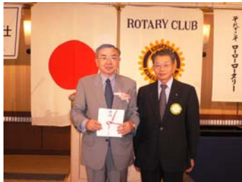
ロータリー財団へ特別寄付 米山記念奨学会へ特別寄付