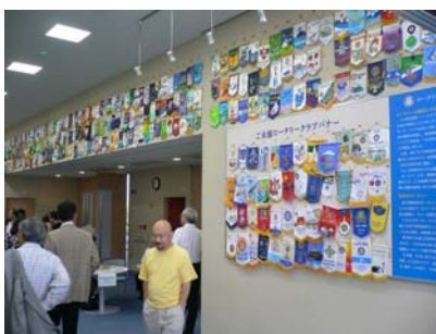
たくさんのバナー