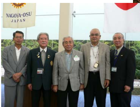
高橋ガバナーと一緒に