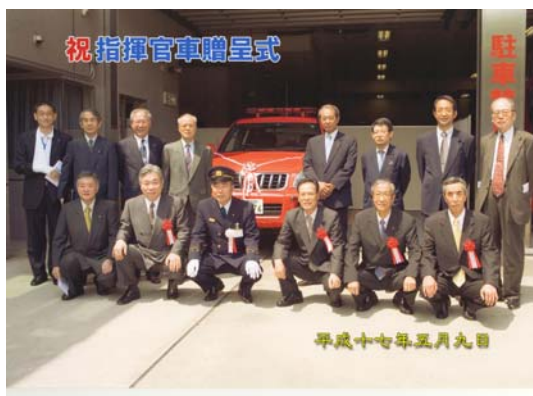
名古屋市中消防署へ指揮官車贈呈 平成17年5月9日 於 名古屋市中消防署 名古屋・中・栄・大須RC 4ロータリークラブ合同で贈呈しました。