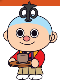
フンソー 第31回国民文化祭・あいち2016 マスコットキャラクター