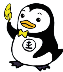
更正ペンギン ホゴちゃん